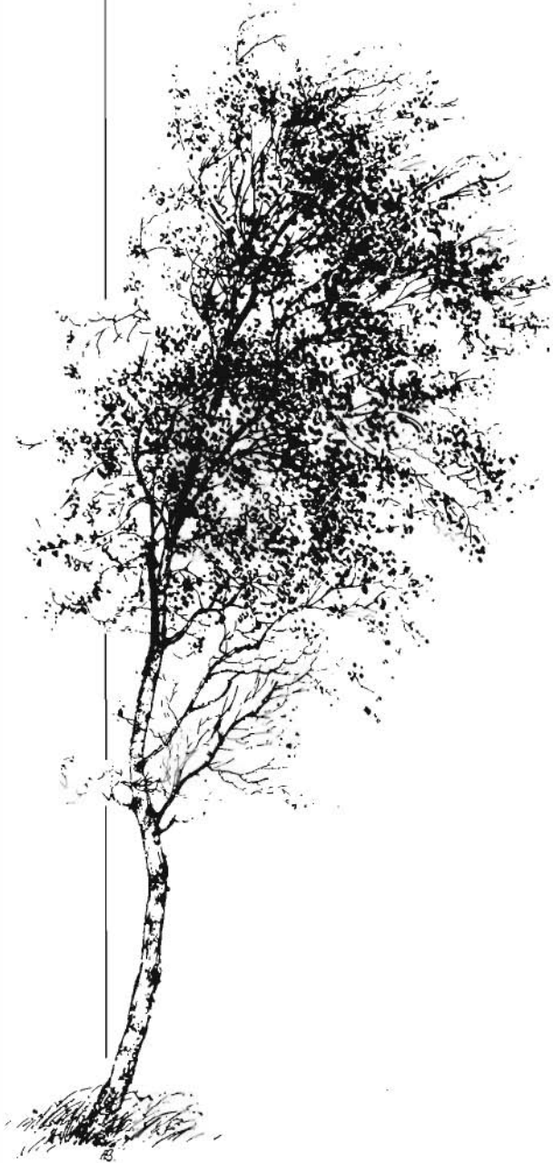
De berk, jonkvrouwe van het bos. tek.: Humphrey Bennett

boom is, die weinig eisen stelt en van alle loofbomen het meest winterhard is (het is de enige imheemse boom van IJsland en Groenland), maar aan de andere kant heeft hij maar een vrij kort leven (70 à 100 jaar) en zacht hout, dat snel verrot. Ook is hij zeer gevoelig voor schadelijke invloeden op de groeiplaats, zoals bijvoorbeeld bodemverdichting en heeft hij een gering herstellingsvermogen. Typisch een pionier dus!