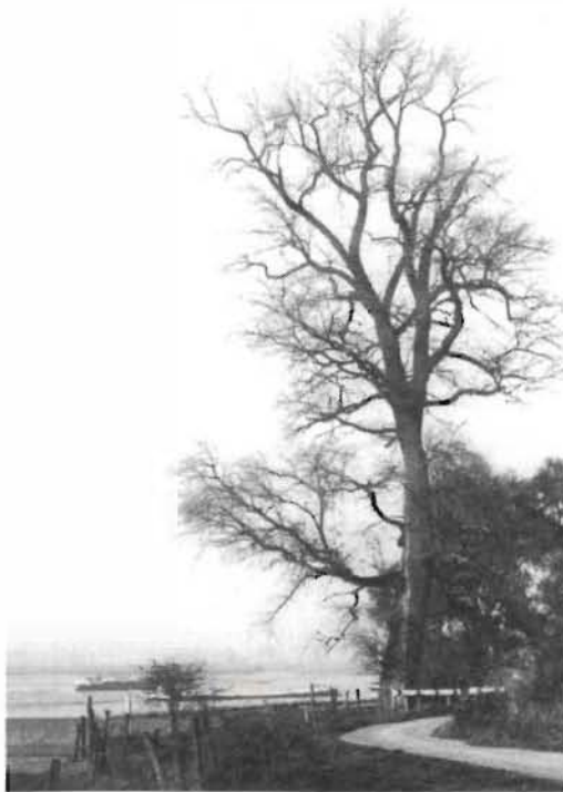
'Baken' populier bij Heerewaarden langs de Waal

laten verzorgen en te behouden. Wanneer er zich activiteiten in die richting voordoen zullen wij u daarvan op de hoogte brengen.